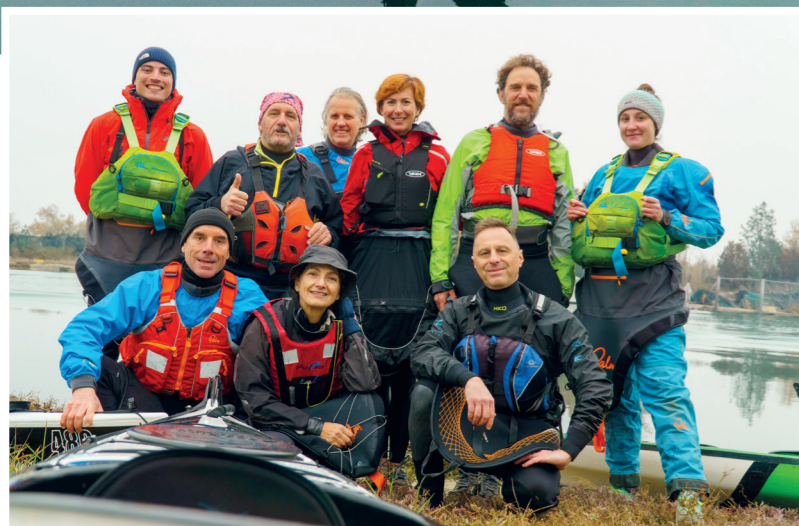
UNA FOTO DI GRUPPO DOPO QUALCHE PANINO E DEL VIN BRULÉ.

SCOPRIRE BURANO DALL'ACQUA È UN'ESPERIENZA UNICA, SOPRATTUTTO IN INVERNO.